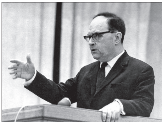
Выступление чл.-кор. АН СССР Ю.А. Косыгина на ученом совете ИГиГ СО АН СССР, 1968 г.

Наконец, для правильного ответа на вопросы, которые ставят перед исследователем и перед геологом производственных организаций современные технологии и практика поисков месторождений нефти и газа, необходимо знать минералогический состав, структуру порового пространства и обстановки накопления осадочных пород — палеогеографию. И Б.С. Соколов, и В.Н. Сакс были выдающимися знатоками этих разделов науки. Б.С. Соколов являлся одним из основных авторов первых палеогеографических карт палеозоя Восточно-Европейской платформы, В.Н. Сакс — известным исследователем