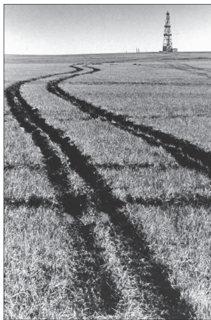
Извилистый путь к открытиям