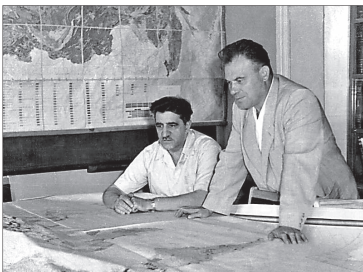
Академик А.А. Трофимук и чл.-кор. АН СССР Э.Э. Фотиади обсуждают проблемы нефтегазоносности Сибири. 1968 г.