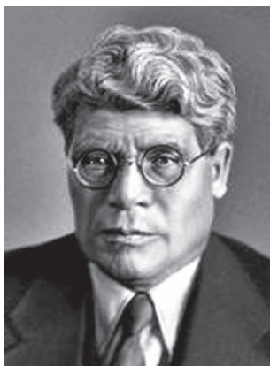
Академик И.М. Губкин

в одном конце графитом и антрацитом, на другом идут до жидкой нефти и газообразных углеводородов. Генетическая причина возникновения этого длинного ряда, в сущности говоря, одна и та же. Только в одних условиях, при наличии материала одного характера... возникает уголь. При другом исходном материале, в других условиях его изменения, возникает нефть. Часто случается так, как говорят геологи, что угольная фация может переходить в нефтяную.